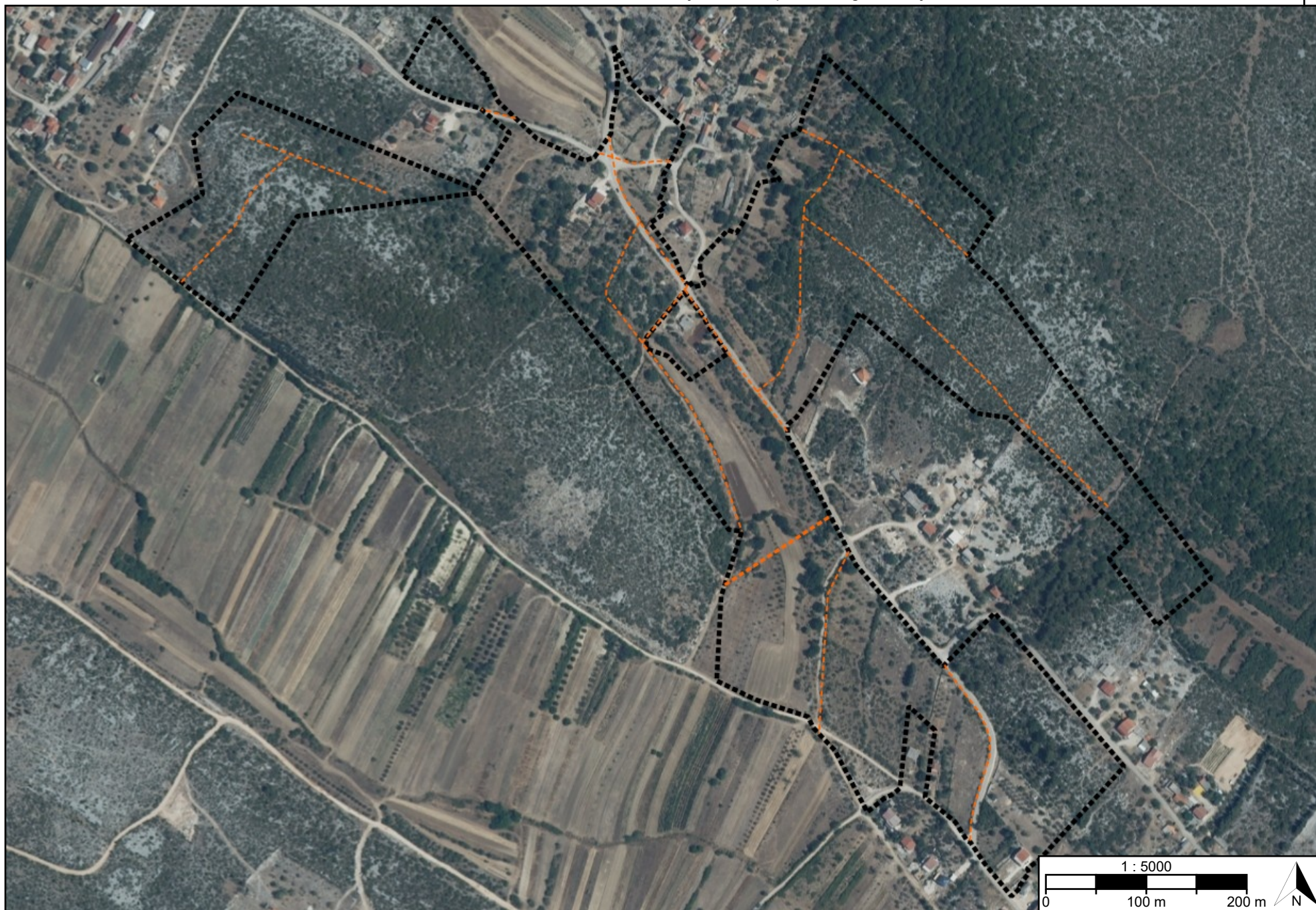
Postupak izrade i donošenja prostornog plana Urbanistički plan uređenja dijela naselja Banjevci - "Gornji Bakovići"