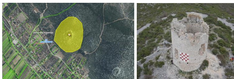
lijevo: granica preventivne zaštite kulturnog dobra; desno: arheološko nalazište Ćulina

Važno je istaknuti da se radi o prostoru čiji dio je unutar granica preventivne zaštite arheološkog lokaliteta, a osim toga je eksponiran u vizurama na lokalitet kule i prapovijesne gradine koja je izvan same zone obuhvata Plana, pa se planska rješenja, smjernice i uvjeti trebaju podrediti posebnim uvjetima nadležne institucije koja štiti kulturna dobra.